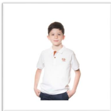
Polo manches courtes blanc

Les pantalons, jupes et robes de votre choix , devront être de couleur foncée (noir ou bleu marine), non-troués, ni délavés.