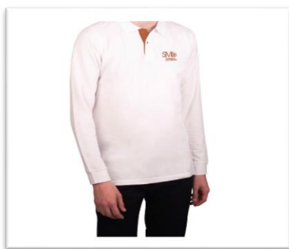
Polo manches longues blanc