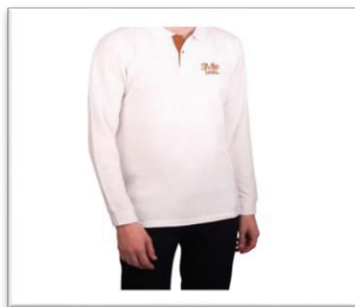
Polo manches longues blanc