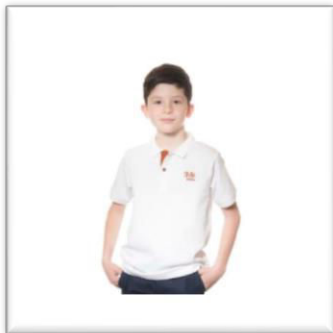
Polo manches courtes blanc

Les pantalons, jupes et robes de votre choix , devront être de couleur foncée (noir ou bleu marine), non-troués, ni délavés.